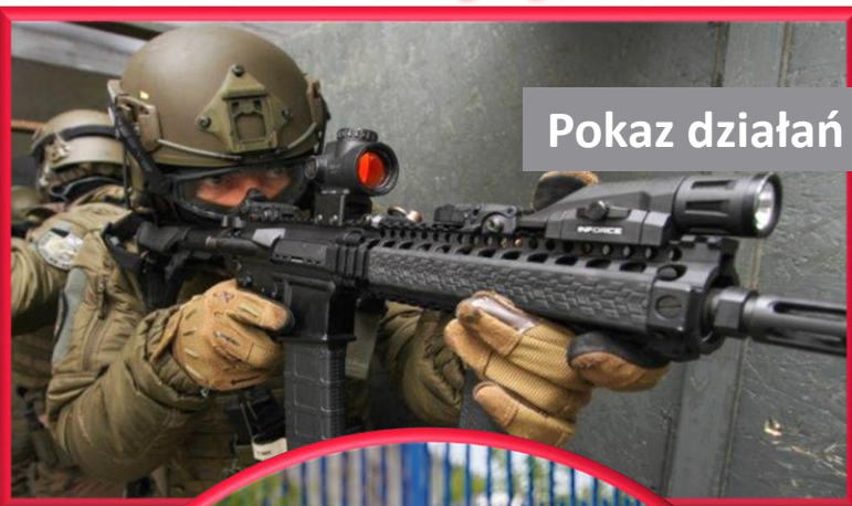
Pokaz działań interwencyjnych